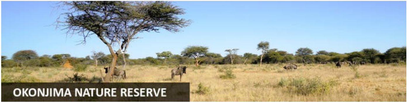
OKONJIMA NATURE RESERVE