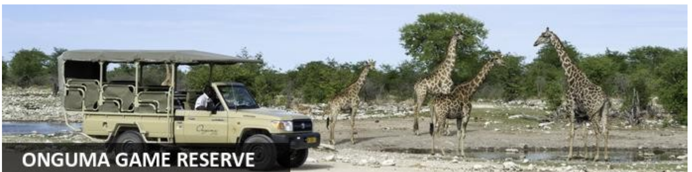
ONGUMA GAME RESERVE