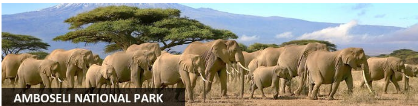
AMBOSELI NATIONAL PARK